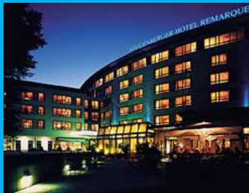
Hotel Remarque**** Natruper-Tor-Wall 1 49076 Osnabrück

Telefon +49 (0) 541-60 69 0 Telefax +49 (0) 541-60 69 600 www.hotelremarque.de