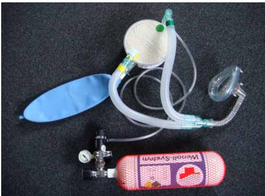
Abbildung 1: Wenoll-System

Nach Abschluss der Therapie ist in jedem Fall eine qualifizierte Diagnostik zur Evaluation der Unfallursache erforderlich. Im vorliegenden Fall wurde als erste Untersuchung eine transösophageale Echocardiographie durchgeführt,