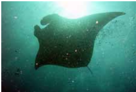
Abbildung 3: .....wie im Großen