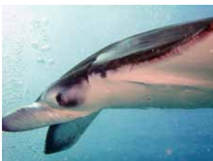
Abbildung 5: Mantas faszinieren und verlocken mit dem Tauchsport zu beginnen (Bild Siegmann, Kuramathi / Malediven, 2009).

die die klare Diagnose eines persistierenden Foramen ovale ergab. Als Pathogenese des Unfalls fand sich somit ein Übertritt von Stickstoffbläschen vom venösen in das arterielle Blutgefäßsystem. Dort sind die Stickstoffbläschen dann bis ins Innenohr gelangt und haben dort die neurologischen Symptome ausgelöst.