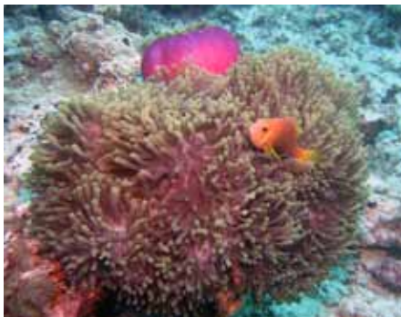
Abbildung 4: Auch Filme aus Hollywood haben zum Tauchsport-Boom beigetragen (Kuramathi/Malediven, 2009)