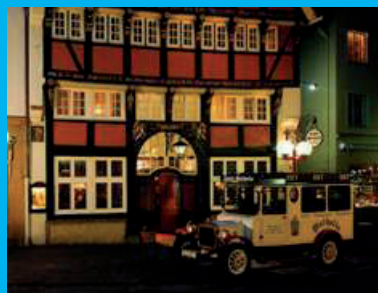
Romantik Hotel Walhalla****s

Einzelzimmer: 100 Euro Doppelzimmer: 120 Euro