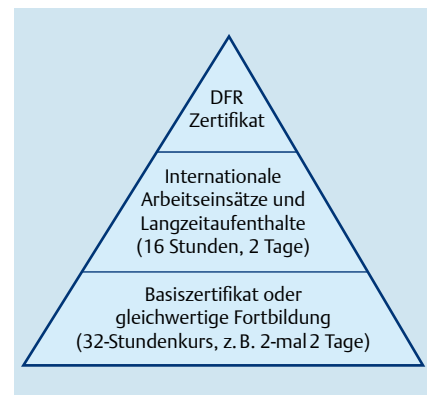
Abb. 2 Geplantes DFR-Zertifikat „Arbeitsmedizinische Vorsorge bei Auslandsaufenthalt“.

Reisemedizinisch erfahrene Ärzte ohne die Gebietsbezeichnung Arbeitsmedizin bzw. die Zusatzbezeichnung Betriebsmedizin oder Tropenmedizin dürfen auf der Vorsorgekarte nicht den Vermerk „keine gesundheitlichen Bedenken“ bescheinigen, selbst wenn sie zuvor im Besitz der G-35-Ermächtigung waren. In diesen und in anderen Fällen bieten sich Kooperationsvereinbarungen mit erfahrenen Reise- und Tropenmedizinern an. Der Betriebsarzt veranlasst in Zweifelsfällen eine Konsiliaruntersuchung und bescheinigt nach Rücksprache die gesundheitliche Unbedenklichkeit (wenn sie besteht) als Tätigkeitsvoraussetzung bei der Pflichtuntersuchung G 35 (ArbMedVV § 4, Abs. 2).